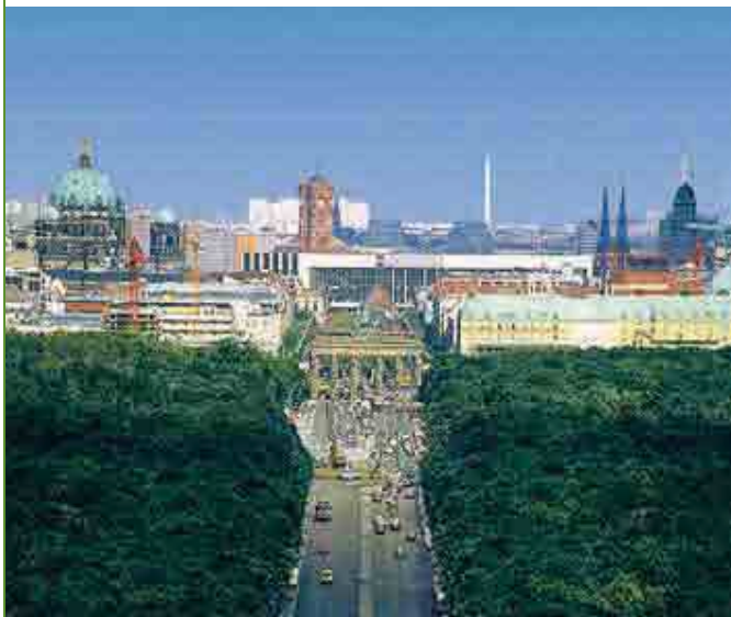
Mit vollem Einsatz für eine außergewöhnliche Stadt.

Entlastend wirken wir auch auf die Geschäfte der Berliner Unternehmen. Die zahlen nicht nur weniger als andernorts für die Abfallentsorgung, sondern profitieren auch massiv von der Auftragsvergabe durch die BSR. Von unserem Gesamtauftragsvolumen – im Geschäftsjahr 2007 immerhin 160 Millionen Euro – blieben 110 Millionen Euro innerhalb der Stadtgrenzen. Weitere 21 Millionen Euro gingen nach Brandenburg.